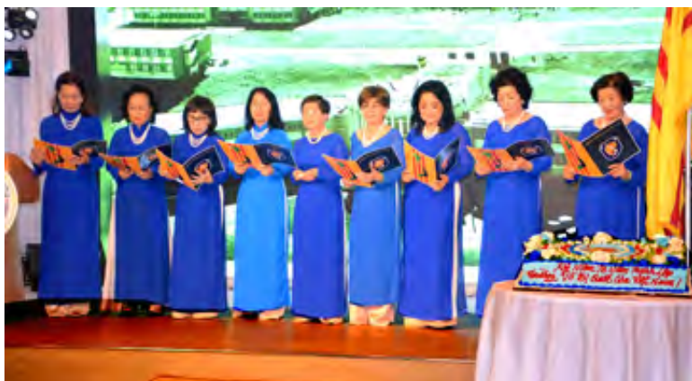
Một màn đồng ca của Khóa 20.

Từ xa, TT đã thấy thấp thoáng những tà áo dài xanh ở bãi đậu xe và hiểu rằng mình đã kiếm đúng địa chỉ.